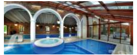
Mäetaguse Spa & Hotel