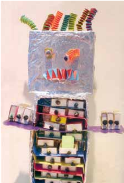
2005. a. üleriigilise energiasäästuvõistluse võitis Joensuu Pataluoto kooli 2.A klass oma leidliku energiasäästurobotiga. Õpilased olid meisterdanud roboti, mille seest võis leida kasulikke juhiseid energia säästmiseks.