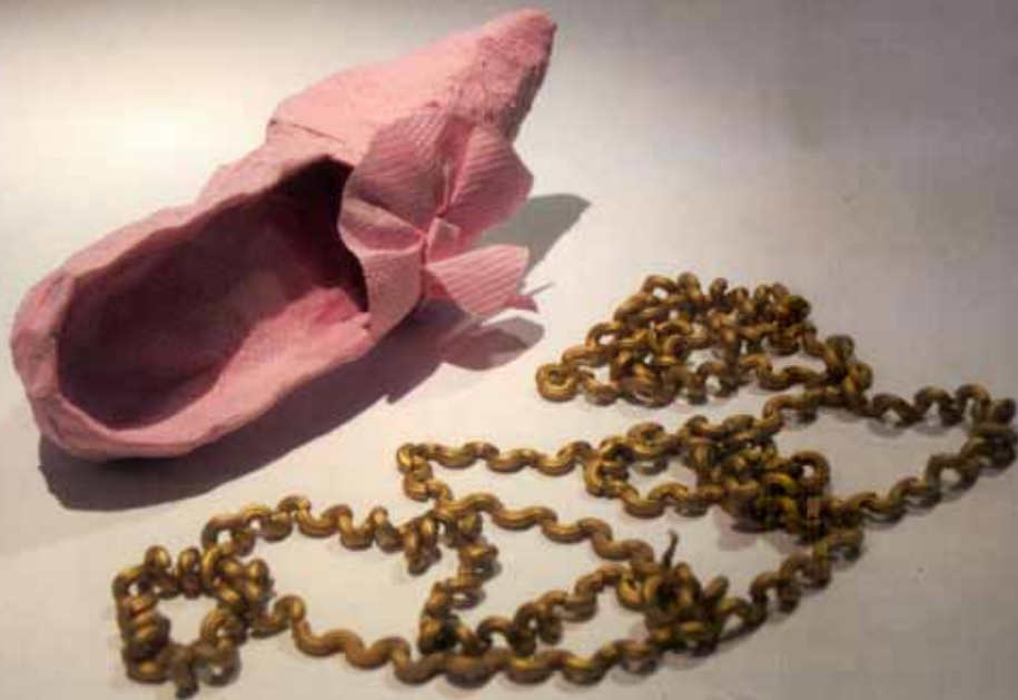
Garderobi- alaprojekti õpilastööde pilt: rokokoo kontskingad värvilisest wc- paberist ja kuldkaelakett makaronidest.

soovitasid ajavahemikku veelgi pikenda või kunstiprojektidest täielikult loobuda. Põhjendused olid juba tuttavad: “Kunstnikke toetab ka riik. Teenused tuleb esmajärjekorras korda saada. Esmalt leiba, alles siis tsirkust.”