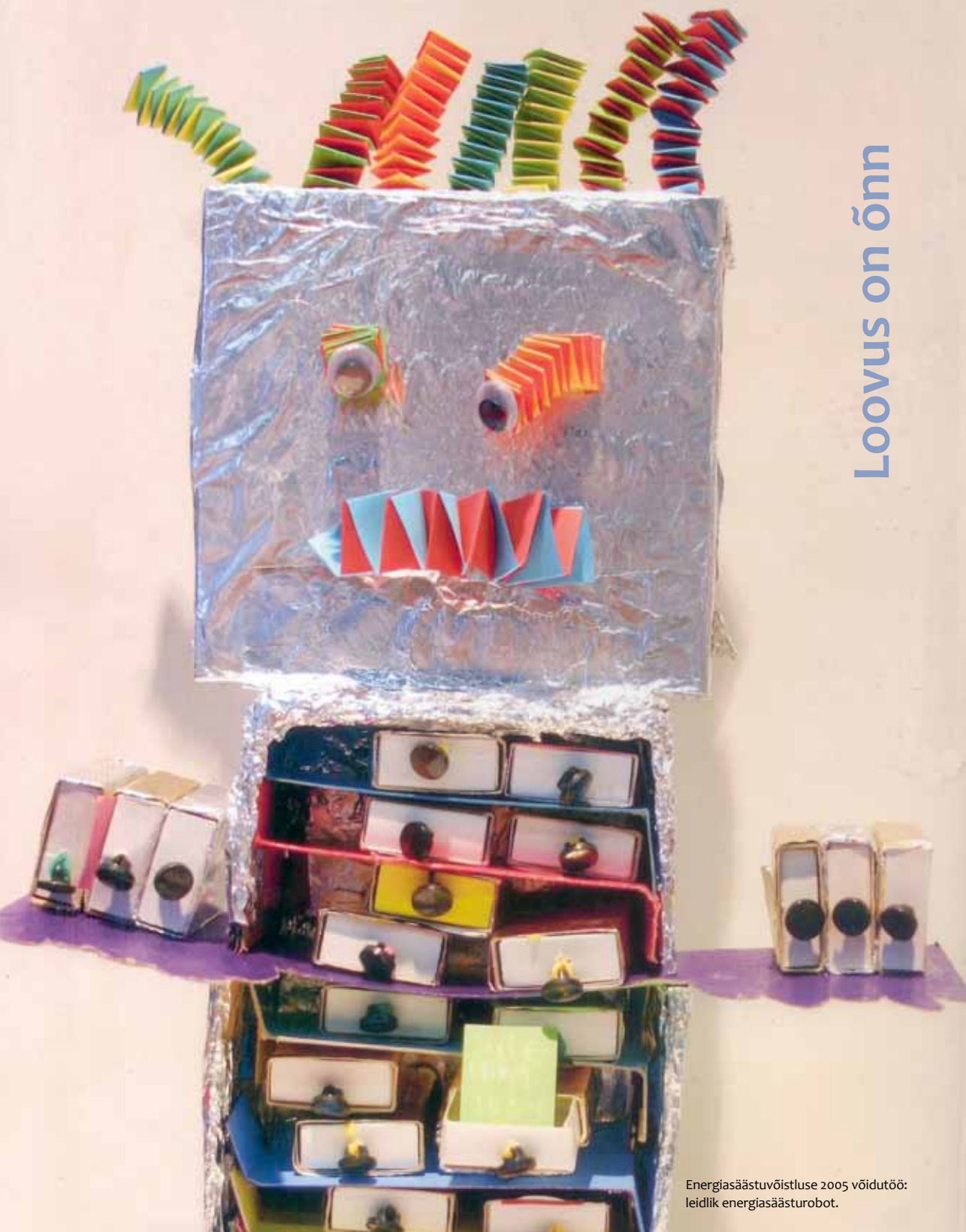
Energiasäästuvõistluse 2005 võidutöö: leidlik energiasäästurobot.