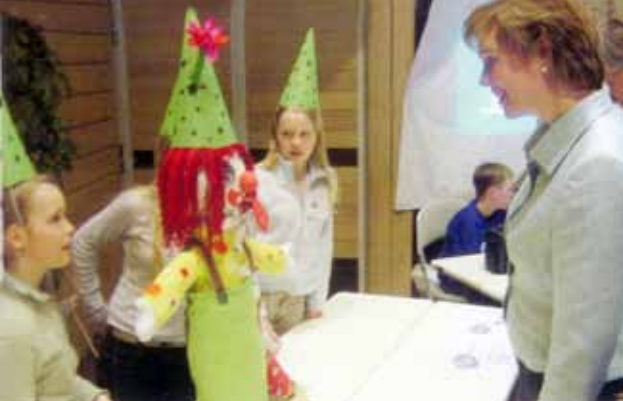
Endine õpetusminister Tuula Haatainen tutvumas Pallo-Pelle lõppvõistlusega.