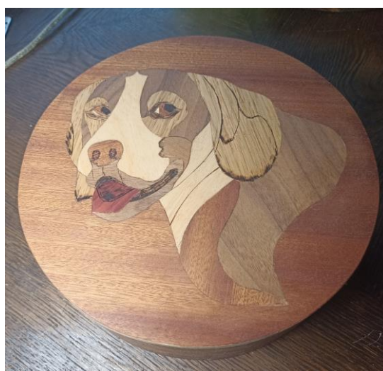
Joonised 1,2,3. Ehtekarp. Liina Kilter (Isiklik arhiiv).